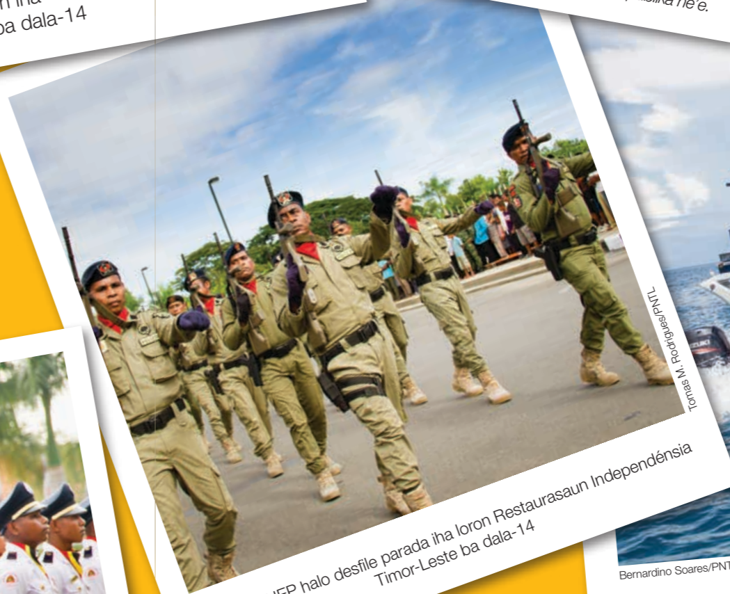
Tomas M Rodrigues/PNTL