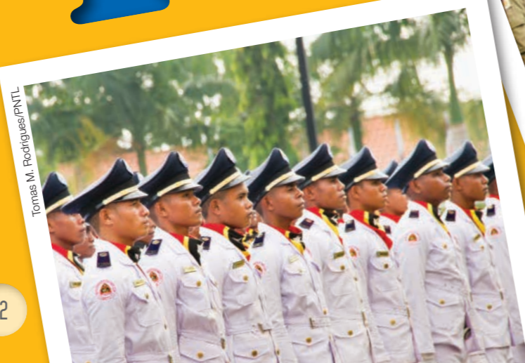
Tomas M. Rodrigues/PNTL