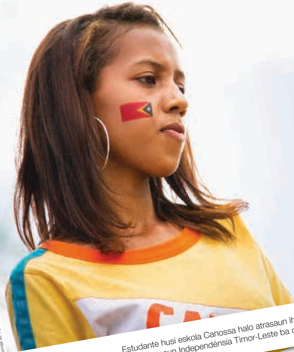
Tomas M. Rodrigues/PNTL