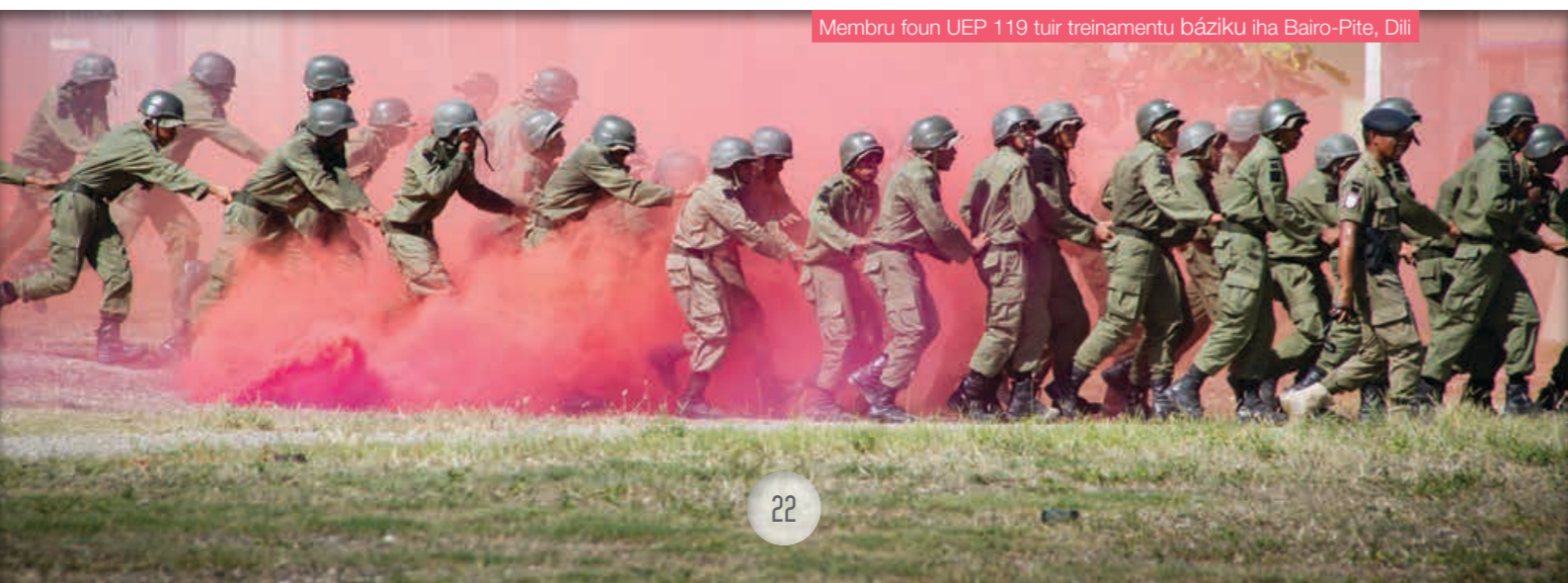
Membru foun UEP 119 tuir treinamentu báziku iha Bairro-Pite, Dili

Komandante UEP hatutan, agora dadaun membru UEP ne'ebé efektivu hamutuk na'in 524 (atus lima ruanulu resin haat). Treinamentu báziku ba membru foun UEP iha tinan ida ne'e fetu laiha.