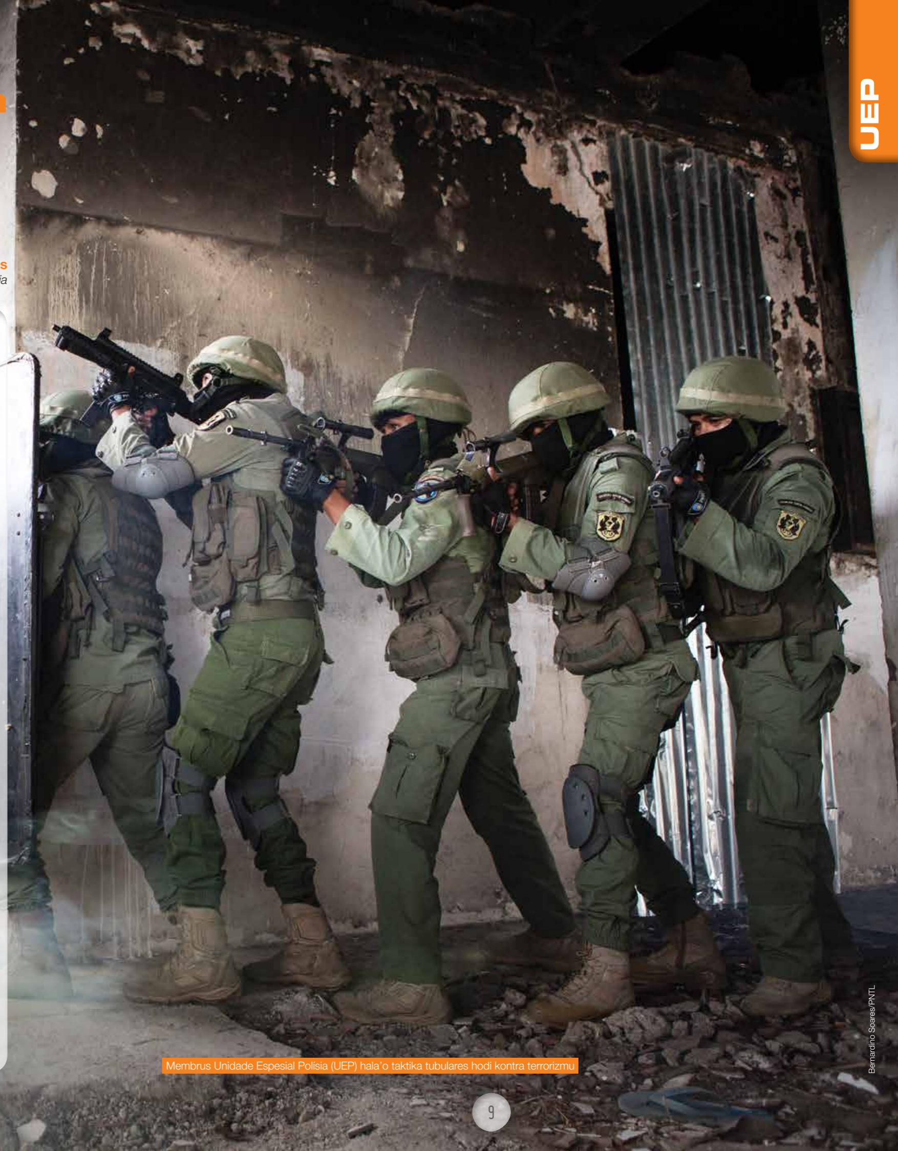
Membrus Unidade Especial Polísia (UEP) hala’o taktika tubulares hodi kontra terrorizmu

Aktualmente UEP iha nia membru hamutuk nain 642, kompostu hosi feto 21 no mane 621.