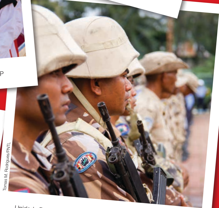
Membru Polísia Tránzitu hala'ó parada preparativu hodi simu VIP sira ne'ebe atu tuir enkontru Simeira CPLP