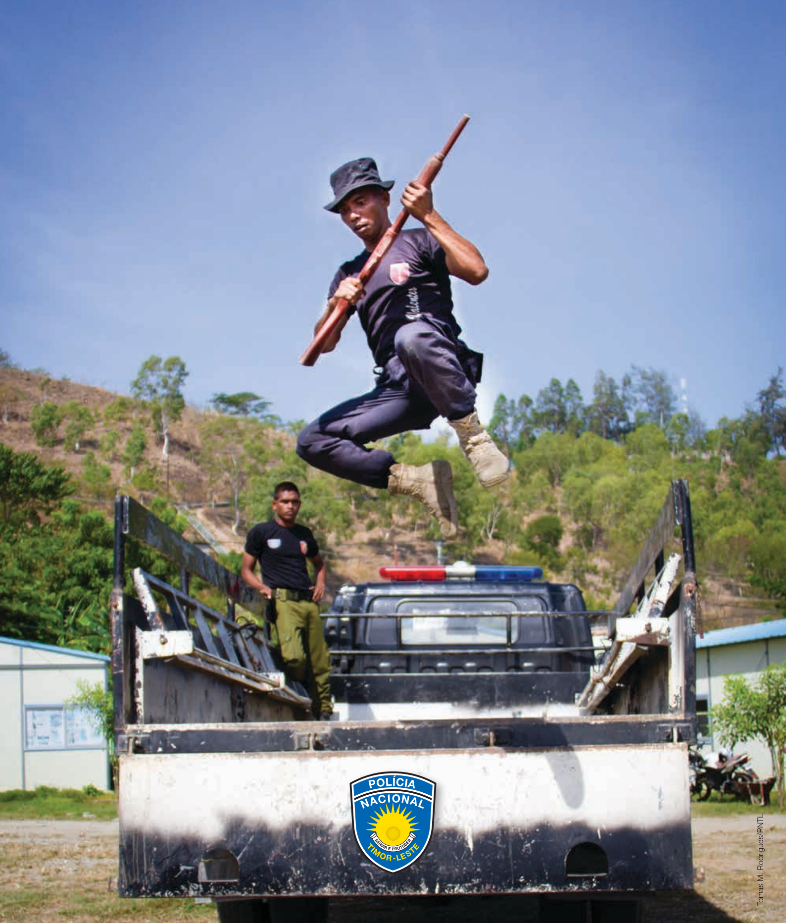
Tomas M. Rodrigues/PNTL