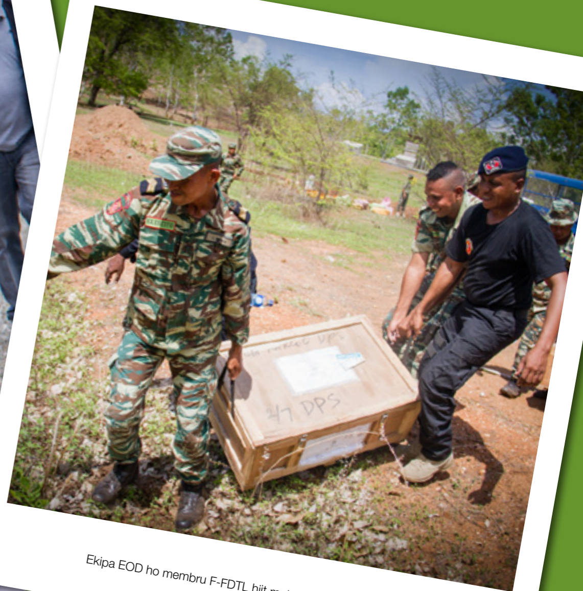
Ekipa EOD ho membru F-FDTL hiit material ne'ebe atu harahun.