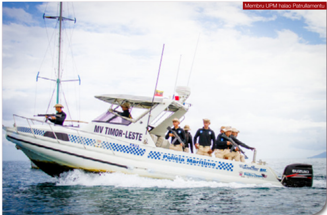
Membru UPM halao Patrullamentu

Partisipante ba serimónia entrega sertifikadu ne'e Embaxador Estados Unidos Amerika, Embaxador Korea do Sul iha Timor-Leste, Komandante Unidade sira seluk nomos familia husi membru UPM nian.