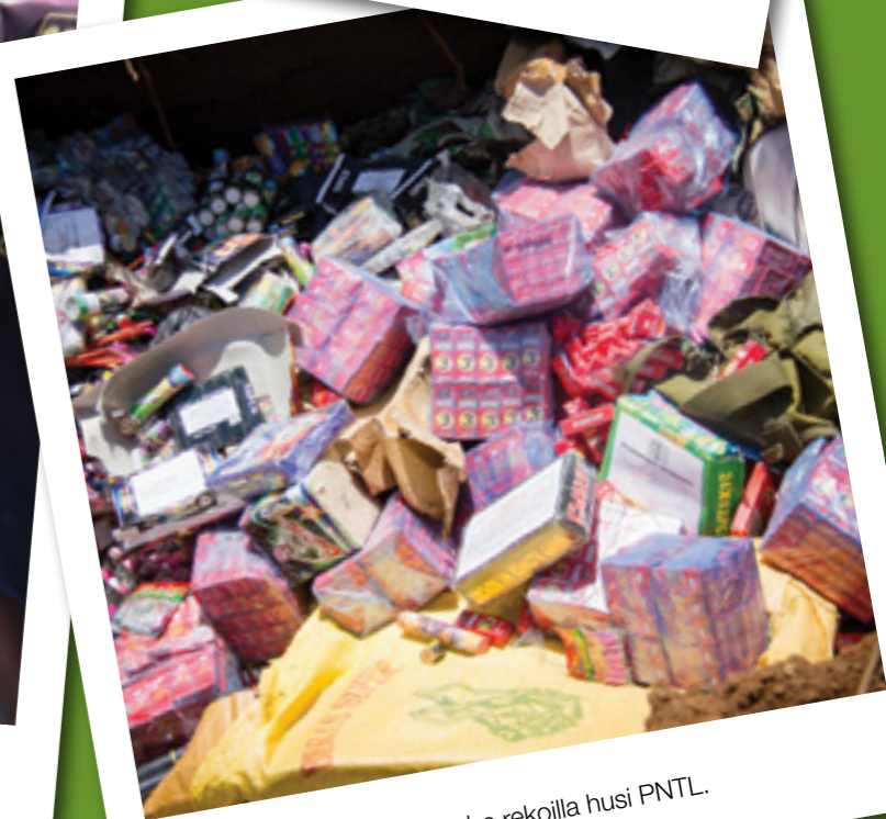
Fugetis ne'ebe rekoilla husi PNTL.