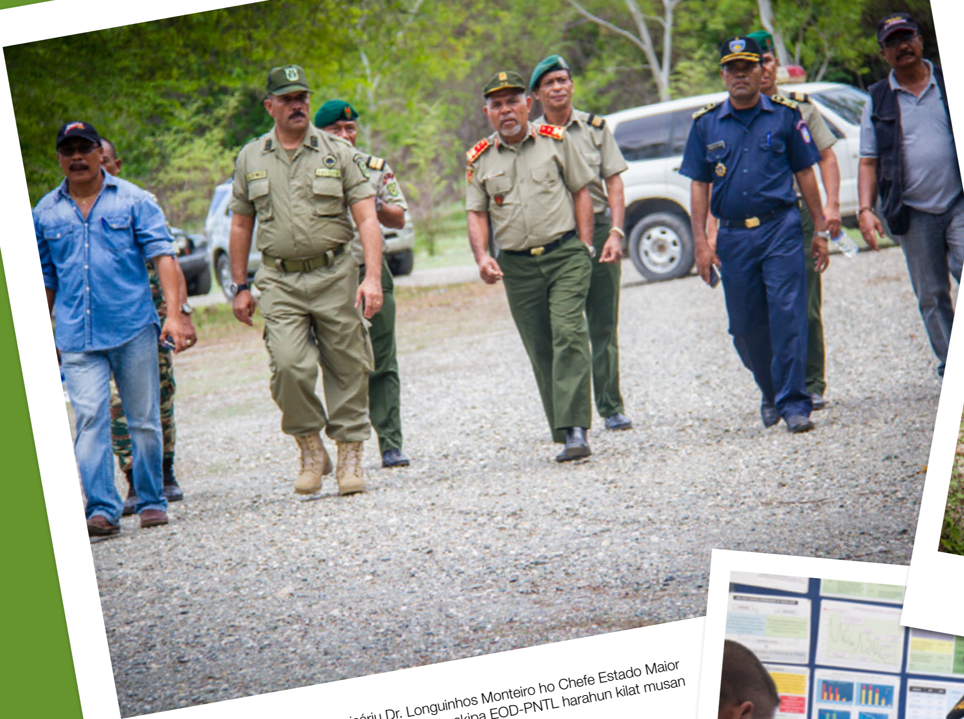
Komandante Jerál PNTL Komisáriu Dr. Longinhos Monteiro ho Chefe Estado Maior F-FDTL Major General Lere Anan Timur, asiste ekipa EOD-PNTL harahun kilat musan no bomba iha Metinaru-Diil.