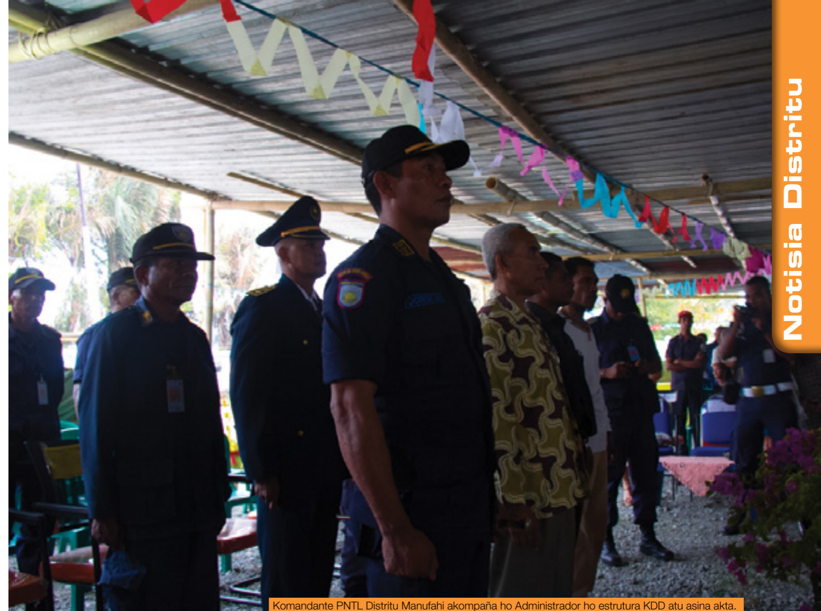
Komandante PNTL Distritu Manufahi akompaña ho Administrador ho estrutura KDD atu asina akta.

Partisipa iha serimonia tomada de posse ne'e mak hanesan Administrador Distritu Manufahi, parseiru sira husi Asia Foundation, Asosiasaun HAK, Parseiru TLCPD, TLPDP, USAID, JICA, Xefe Departamentu Polisia Komunitária Nasionál, Asesor Komandante Jerál, Komandante Distritu Lautem, Aileu, Komandante Eskuadra no Administrador Sub Distritu 4 hanesan Same Vila, Alas, Turiskai, no Fatuberliu, Xefe Suku 29, representante husi Instituisaun Estadu no Governu, membru PNTL, comunidade no konvidadus tomak.